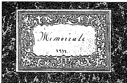
Etichetta sulla copertina.

Nato a Oga in Nato in Valdisotto nel 1850, l'autore visse nel paese dell'Alta Valtellina fino al 1931, dilettandosi a "mettere in iscritto" il memoriale dei diritti della gioventù di Oga - anno 1877 e la storia dagli avvenimenti avvenuti in Oga.