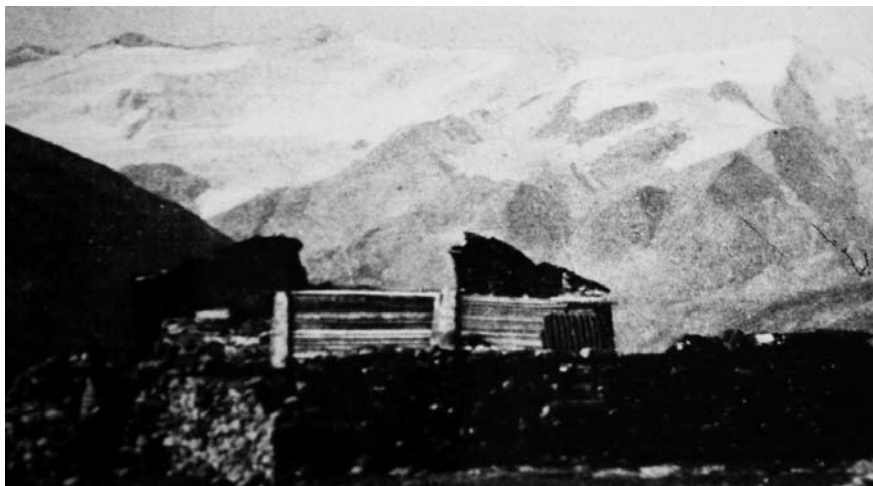
La Capanna Cedech

installato un centralino facente capo a Bormio e congiunto con località montane. Oltre la sorveglianza delle linee, si aveva il compito di ricevere e trasmettere messaggi fra il comando e i vari posti avanzati. Il 25 febbraio di quel 1916, la furia del vento e della neve, si era scatenata tremenda in tutta la vallata. I telegrafisti di «Case bruciate», per tutta la giornata, sotto la tormenta, erano accorsi in varie località dove i fili erano stati spezzati. Riattivate le linee, la sera, stanchi e gelati si erano ritirati nella loro baracca per godersi il meritato riposo. Ma ecco che verso le 18 avviene uno schianto come di proiettile scoppiato e la baracca dei telegrafisti sminuzzata, trasportata quale piuma, gettata giù nel torrente ghiacciato Braulio. Una valanga staccatasi dal Pizzo Reit era calata tremenda, asportando tutto nel suo vorticoso cammino. Sepolti dalla neve, fra i rottami della baracca, giacevano gli 8 soldati. Nessun soccorso poteva essere loro portato giacché ogni comunicazione era rimasta interrotta e la notte ormai era calata. Fu notte tragica per chi scrive, fu agonia per i 7 compagni! Le loro grida di aiuto, le invocazioni della mamma, le preci a Dio, risuonano ancora nell'animo mio. Poi quelle voci, una, ed una si spensero e sul candido lenzuolo di neve, si stese quello funebre della morte.