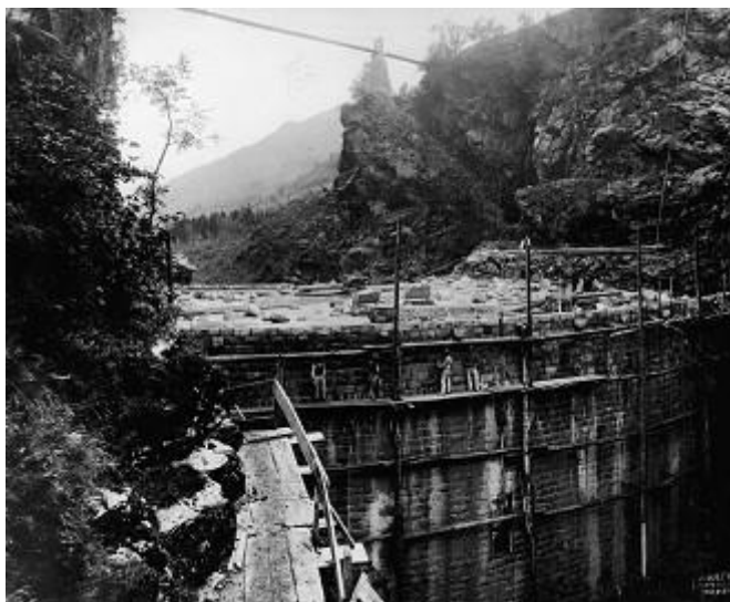
La diga di Fusino in Valgrosina in costruzione.

dovuto alla nazionalizzazione dell'energia. I Comuni, non solo quello di Milano ma tutti quelli che avevano creato una loro municipalizzata, dovettero decidere se farla vivere o accorparla alla neonata ENEL. Milano, come la gran parte delle Amministrazioni, decise di mantenere l'Azienda anche se, tale scelta non fu priva di limitazioni sulla gestione delle attività.