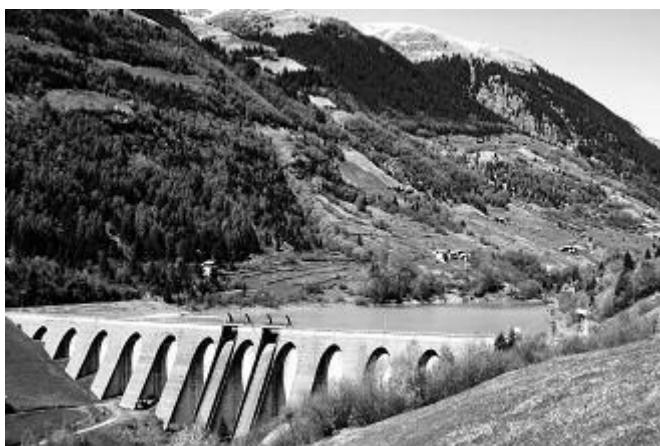
La diga di Fusino in Valgrosina.