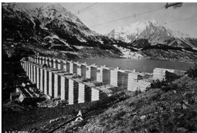
La diga di S. Giacomo di Fraele in costruzione.

A metà degli anni '90, la Municipalizzata diventa una Spa, si prepara ad entrare in borsa e congiuntamente l'Italia nel 1998, dopo 35 anni dalla nazionalizzazione e di monopolio ENEL, il mercato elettrico si liberalizza con il "Decreto Bersani". AEM, con a capo il Valtellinese Giuliano Zuccoli, si attiva nella "politica del fare" e mette in cantiere e velocemente realizza importanti investimenti che portano al raggiungimento dei seguenti obiettivi: