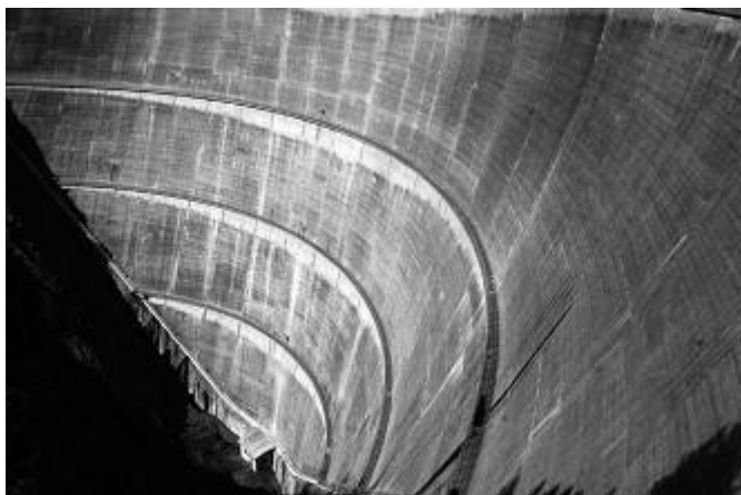
La diga di Cancano.

in seguito denominata “prima diga di Cancano”. I lavori durarono diversi anni anche a causa delle condizioni climatiche e della distanza del luogo di lavoro che costringevano spesso a interruzioni, soprattutto nel periodo invernale. L’impianto entrò in servizio nel 1928.