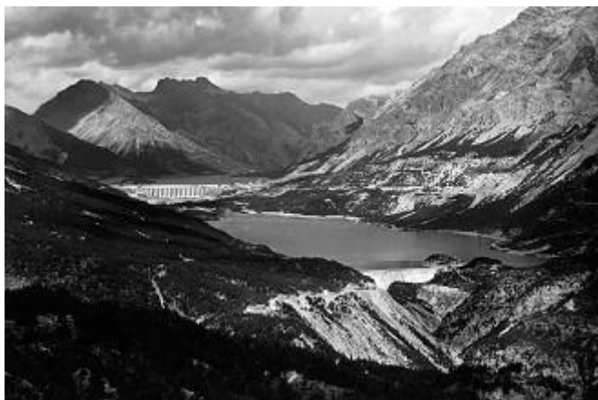
La prima diga di Cancano.