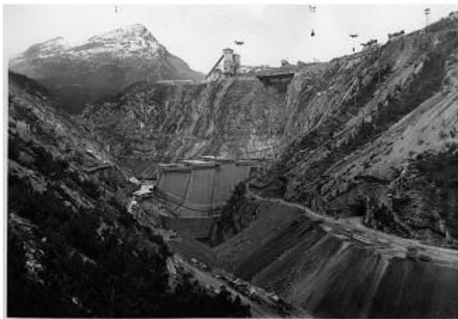
La diga di Cancano in costruzione.