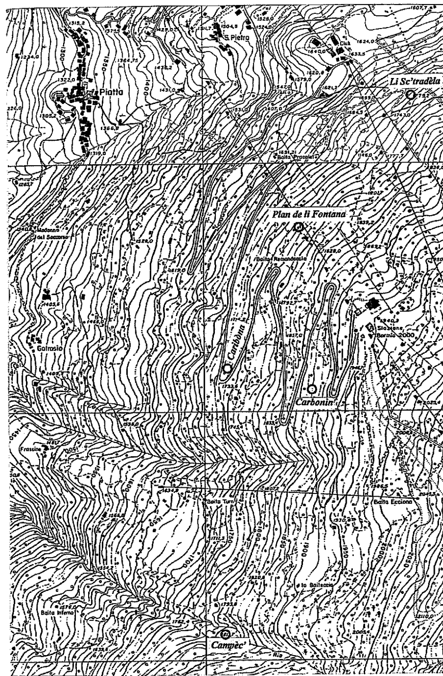
Fig. 2 – (pagina seguente) Ubicazione delle località in cui si trovano massi con incisioni coppelliformi. (Carta tecnica regionale 1:10.000, fogli Bormio e Valle di Sotto est)