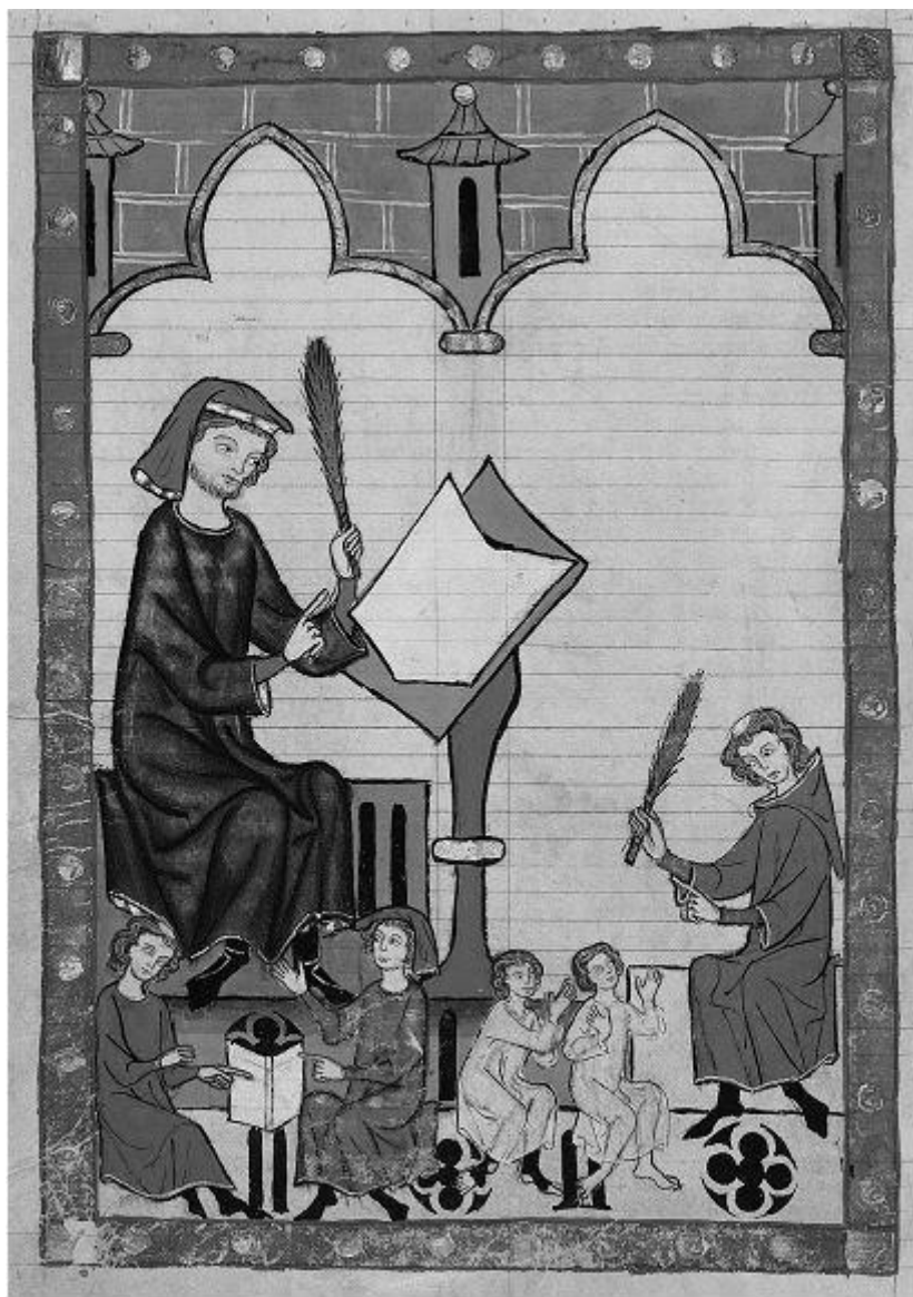
Codex Manesse: il maestro di Esslingen