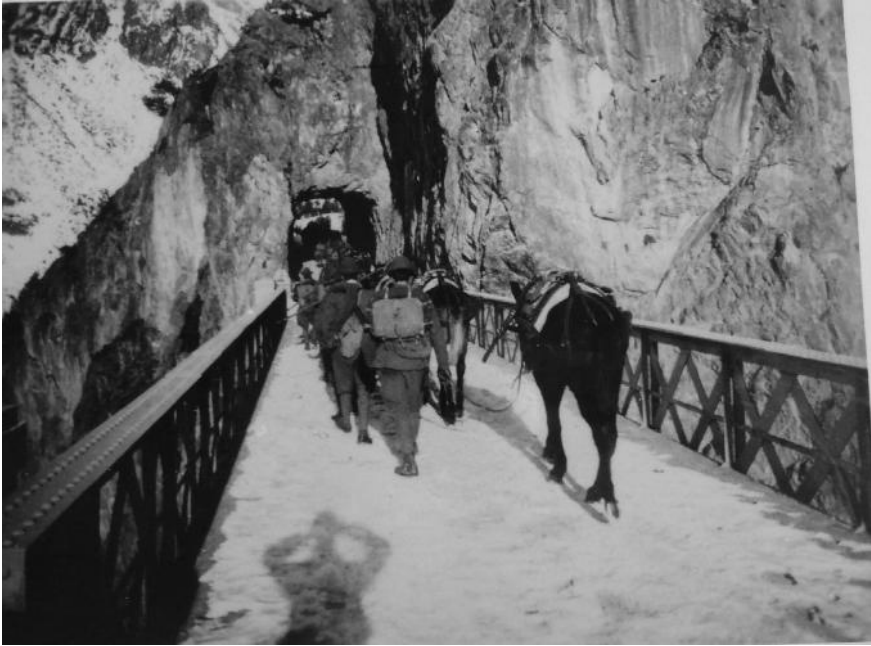
Soldati transitano sul ponte dei Bagni diretti verso lo Stelvio

3) Esercizi pubblici. Gli Alberghi ed i Caffè rimarranno aperti fno alle ore 23. Tutti gli altri esercizi (Osterie, Bettole, R. Privative, ecc.) dovranno essere chiusi alle ore 21. Agli esercenti che si rendessero colpevoli di infrazione a tale divieto, verrà ritirata la patente di esercizio, senza pregiudizio di ogni ulteriore azione di legge.