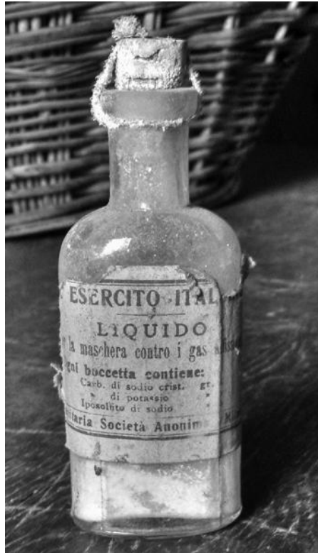
Boccetta in uso ai soldati ( propr. Bait de Moleta di Oga)

solo laddove, al di là del Brennero, scorre l'Inn; laddove il parlare è cangiato in urla, il suolo è orrido, il sole è sempre come al 21 dicembre; laddove le case sono aguzze e tonde le persone e non laddove imbruna l'uva, profuma l'arancio e alligna l'ulivo. 4 Anche le arti servivano allo scopo: teatro, musica, poesia, tutto doveva immolarsi sull'altare della patria e celebrarne i fasti: i giornali pubblicavano poesie patriottiche tra le quali segnaliamo una roboante "Cavalcata dei morti", composta dal prof. Giuseppe Moro in favore delle famiglie dei richiamati e dedicata ai soldati del battaglione Stelvio. 5 Oltretutto