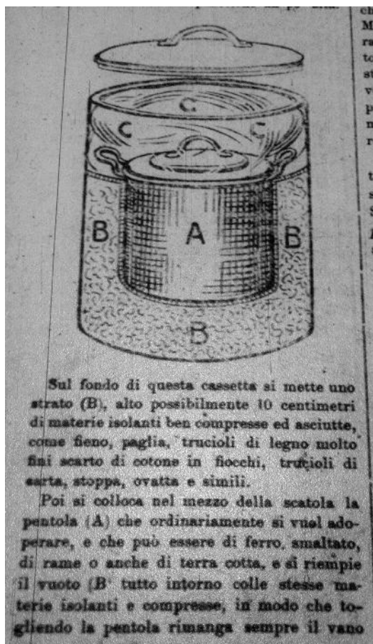
Disegno della "pentola economica"

stalle. Insomma la loro vita continuava a svolgersi calma e normale, suscitando l'ammirazione di tutti i Valtellinesi, in primis del sindaco di Sondrio che li elogiò generosamente. 24 Diversi provvedimenti, invece, miravano alla salvaguardia dei bambini coinvolti dalla guerra, creature costrette ad assumersi delle responsabilità ben più gravose di quelle adatte alla loro età o che vagavano abbandonate a loro stessi, mentre le madri si occupavano dei lavori dei campi. La tutela e la protezione dell'infanzia, che nella retorica dell'epoca era vittima innocente del furore bestiale delle orde e degli egoismi degli austroteutonici , rappresentava il fulcro di una serie di attività tese all'istruzione, alla vigilanza, all'assistenza sanitaria e al sostegno economico in favore di questi piccoli f gli