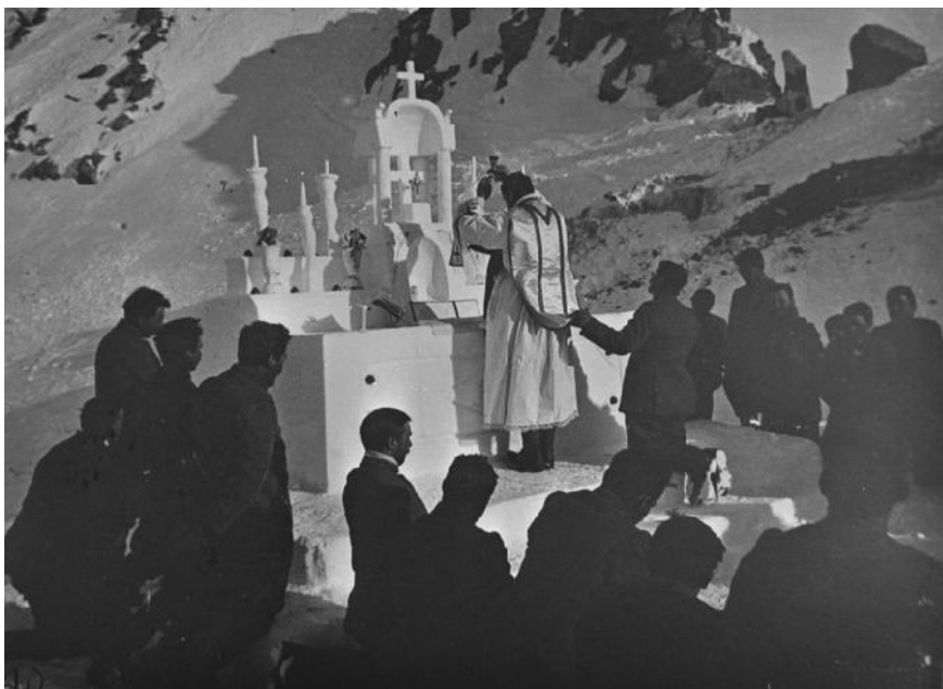
Messa con altare di neve sul fronte ghiacciato dell'Adamello (fonte AIGG)

poche righe ai fatti d'arme, principalmente estratti dagli stringati Bollettini del Comando Militari; raramente i corrispondenti si spingevano sul fronte, anche perché l'accesso alle zone di guerra era vietato, perciò ci si affdava alle notizie che circolavano, trascurandone un po' l'attendibilità o rimandandone l'accertamento a un momento successivo. Nell'agosto del 1915, tuttavia, lo Stato Maggiore dell'Esercito concesse a un gruppo di giornalisti di potersi recare al fronte proprio a partire da quello dello Stelvio. Il celebre corrispondente Luigi Barzini 13 ne approfittò per riportare in modo circostanziato l'attacco che un drappello di austriaci eseguì in val Cedec, pubblicato su Il Corriere della Sera e riportato da Il Corriere della Valtellina : COME AVVENNE L'ATTACCO ALL'ALBERGO DEI FORNI . 9 agosto 1915. Una cinquantina di cacciatori tirolesi attraversarono i ghiacciai per attaccare l'albergo del Forno. È un piccolo e grande albergo da villeggianti eretto sopra un verde pianoro in una