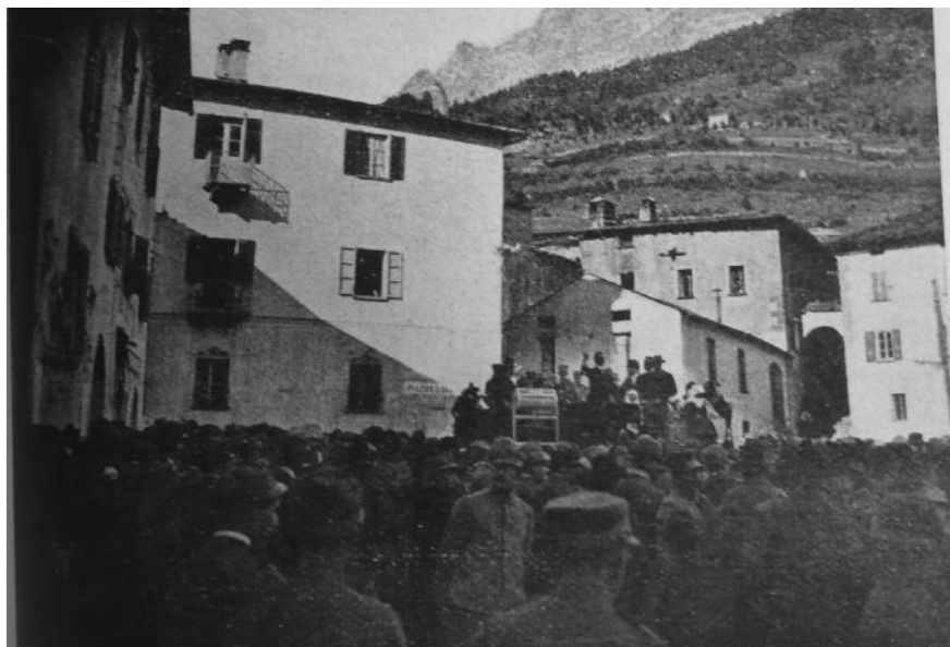
Estrazione dei premi della Lotteria in piazza Cavour a Bormio

anche un laboratorio sartoriale, sia per la produzione a nuovo, sia per lavori di rammendo, che nel solo 1915 trattò 335 capi di vestiario. 17 Per avere un'idea dell'azione del Comitato si pensi che alla fine del 2015 risultavano entrati in magazzino ben 1554 maglie di lana, 38 corpetti, 179 pettorine, 111 pezze piedi , 420 camicie di tela e f anella, 218 mutande di lana tela e cotone felpato, 431 passamontagna, 16 calzettoni da montagna, 254 guanti di lana, 81 polsini, 32 sciarpe, 57 ventriere, 98 neccessaire , 99 ponci , 27 pantofole, 84 fazzoletti, 3 ginocchiere, 151 colli e 56 salvapunte, per un totale di 3909 capi di vestiario, che venivano accuratamente lavati, sterilizzati e rammendati prima della distribuzione. Le raccolte si eseguivano in tutto il circondario ed anche al di fuori, persino da oltreoceano giungevano donazioni in denaro. 18 Al 31 dicembre